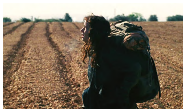
Sans toit ni loi