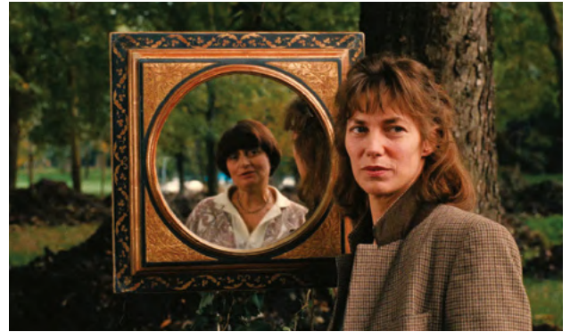
Jane B. par Agnès V.

l'image dans Les Plages d'Agnès et Visages, villages . Mais, dans son œuvre de fiction, c'est paradoxalement dans les personnages masculins que Varda, la femme et la cinéaste, s'est livrée le plus intimement ; il y a en effet beaucoup d'elle dans cet homme en crise qui revient dans son village natal (Philippe Noiret dans La Pointe courte ), dans cet écrivain en panne d'inspiration (Michel Piccoli dans Les Créatures ) ou encore dans ce M. Cinéma miné par la peur du vieillissement et de la solitude (Michel Piccoli dans Les Cents et une nuits ).