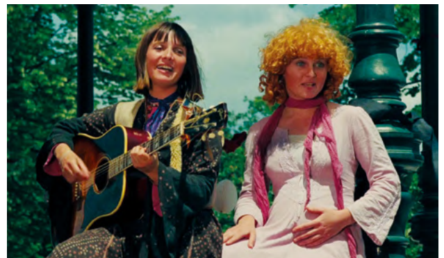
L'une chante, l'autre pas