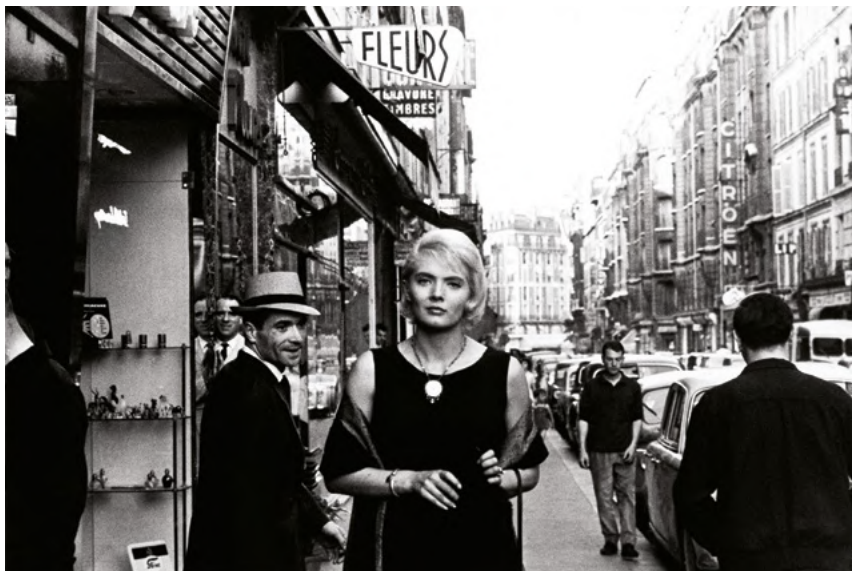
Liliane de Kermadec

Bien que n'étant pas indiquée, la durée du prologue peut