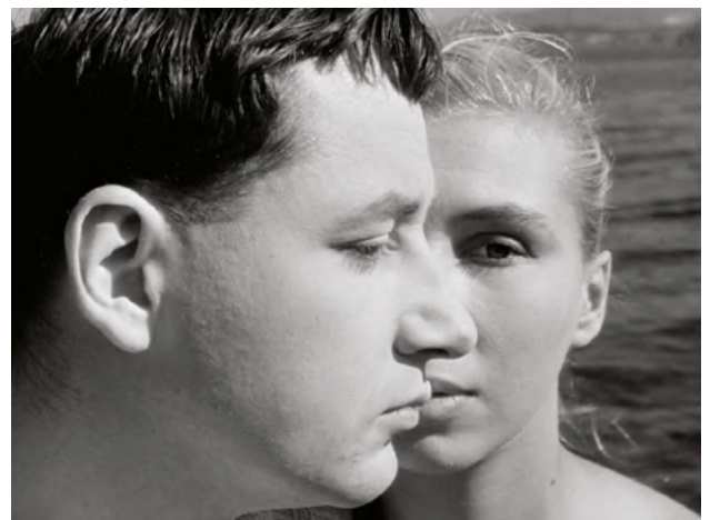
La Pointe courte