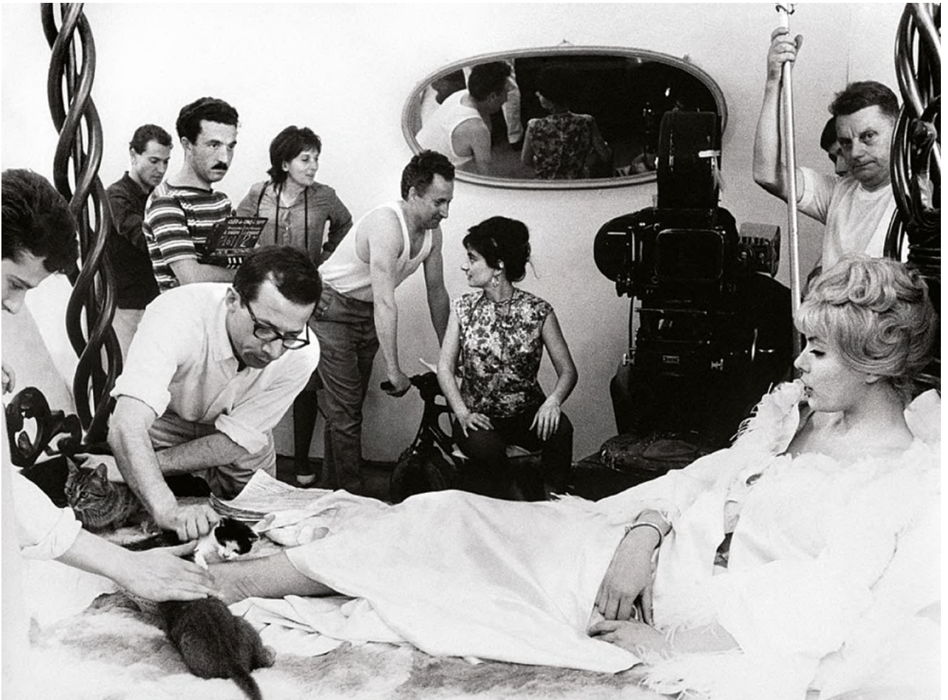
Liliane de Kermadec